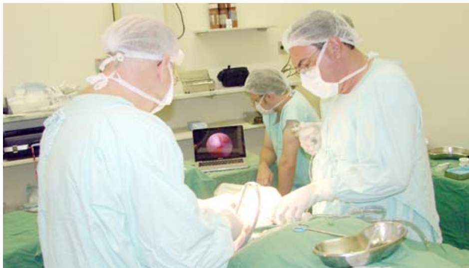
O procedimento cirúrgico é minimamente invasivo e já está sendo realizado há cerca de quatro meses pela Santa Casa

O procedimento cirúrgico é minimamente invasivo e já está sendo realizado há cerca de quatro meses pelo Departamento de Cirurgia e Traumatologia Buco Maxilo Faciais do Hospital, permitindo explorar o interior das articulações para combater as disfunções temporo-mandibulares. "O procedimento permite a retirada de adesões que limitam a mobilidade das articulações,